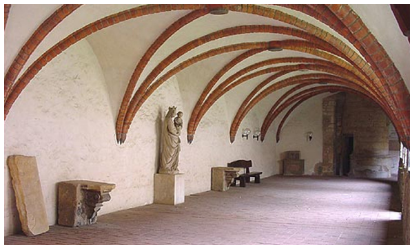
Der Kreuzgang, heute zur Marienschule gehörig

Am 3. Mai dieses Jahres sind wir Ursulinen mit einer Unterbrechung 161 Jahre in Hildesheim.